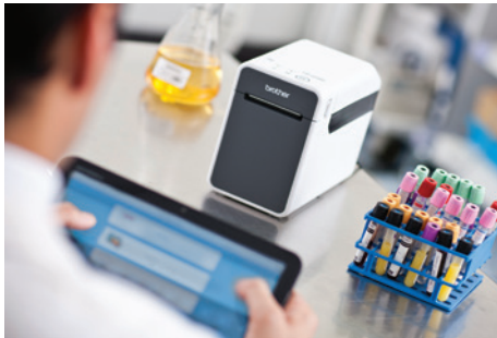
Vergroot de vrijheid en mobiliteit - print draadloos vanaf vrijwel elk tablet of mobiele apparaat

De Mobile Software Development Kit (SDK) maakt het voor programmeurs en software developers eenvoudig om het printen van labels en ontvangstbewijzen te integreren in mobiele apps. Er zijn SDK pakketten beschikbaar voor iOS™, Android™ en Windows Mobile™.