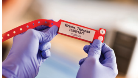
Print patiënteninformatie wanneer dit nodig is