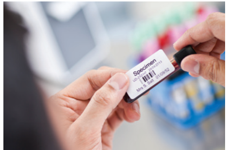
Special ontworpen labels zijn eenvoudig toe te passen