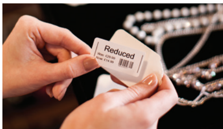
Maak ter plekke duidelijke verkooplabels terwijl u door de winkel loopt