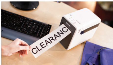
Met de doorlopende rollen kunt u grote banners en bewegwijzering creëren

Verhoog de productiviteit en biedt uw winkelmedewerkers een breed scala aan labels en etiketten, die direct op de werkvloer kunnen worden afgedrukt op de TD-2000 via een laptop of een mobiel werkstation. Dankzij het compacte ontwerp is de TD-2000 ook bij uitstek geschikt voor een drukke werkplek of winkelbalie, zonder dat dit ten koste gaat van waardevolle werkruimte die een desktopprinter zou innemen. Scherpe tekst, logo's en barcodes worden razendsnel geprint op hoge kwaliteit Brother papier of labels. Dit draagt bij aan een verhoogde klanttevredenheid aan uw balie.