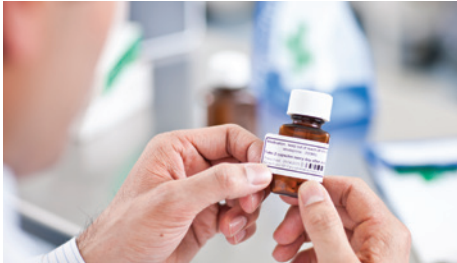
Labelformaten kunnen worden aangepast, zodat deze geschikt zijn voor elke toepassing

De netwerkmodellen (2120N en 2130N) bieden werknemers in de gezondheidszorg de mogelijkheid om snel en draadloos een grote verscheidenheid aan barcode labels te printen op elke gewenste plek of in elke situatie. Zoals in het laboratorium, de apotheek, de receptie of zelfs aan het bed van de patiënt. Met ondersteuning voor de meest voorkomende barcode protocollen, zijn alle modellen bij uitstek geschikt voor elke labeltoepassing in de gezondheidszorg.