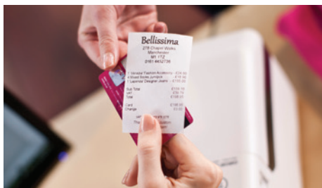
Print razendsnel duidelijke en beknopte aankoopnota's