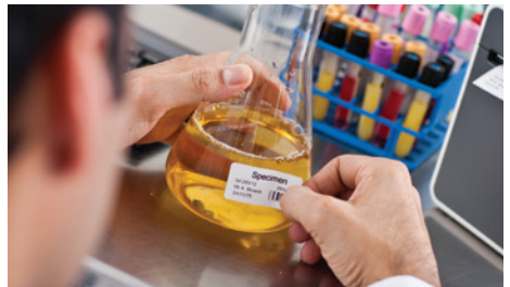
Monsters kunnen veilig worden geïdentificeerd met duidelijke labels