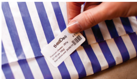
De lijm die gebruikt wordt voor Brother RD-rollen is veilig en gecertificeerd voor het labelen van levensmiddelen