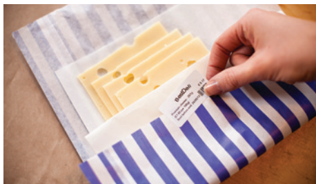
Geef uw klanten alle benodigde informatie over producten, ingrediënten en houdbaarheid