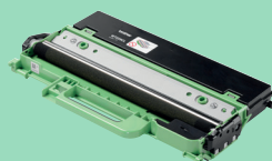
Toner opvangbak WT-229CL