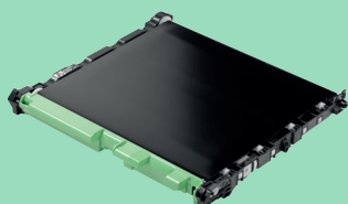
Belt unit BU-635CL