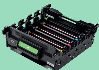
Drum unit DR-625CL