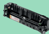
Fuser unit FD-5000

Invoerrol set voor universele papierinvoer PF-M5000